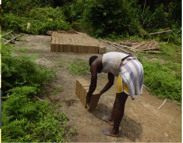
Visite à Mgr Mbwol et Kimputu